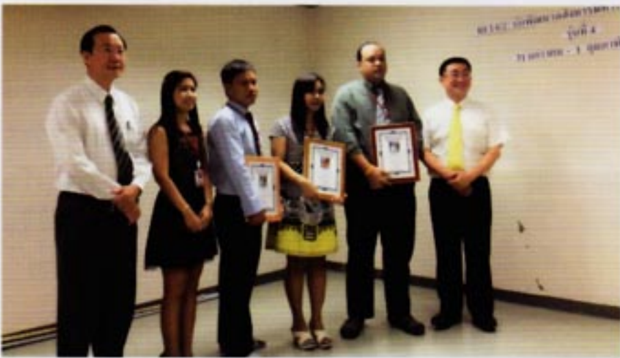
การทำดีโดยเฉพาะกับผู้ใช้ชีวิตในที่สาธารณะเป็นกุศลสำคัญอย่างหนึ่ง

แม้ภาคเอกชนเช่น สภาหอการค้าไทยจะออกมากระตุ้นการปราบปรามการทุจริตโกงกิน จนหลายฝ่ายมองพันธกิจการแก้ไขปัญหาน่าจะอยู่ที่ภาคประชาสังคม ภาคเอกชนและองค์กรอิสระ แต่ในความเป็นจริงรัฐบาลต่างหากที่เป็นผู้นำหลักในการแก้ไขปัญหา เพราะปัญหาหลักอยู่ที่ภาครัฐบาล ทั้งนี้เพราะคงไม่มีภาคเอกชนใดไปติดสินบนข้าราชการหากไม่ถูกเรียกร่องแกมบังคับ การจ่ายสินบนยอมทำให้ต้นทุนของสินค้าและบริการเพิ่มสูงขึ้น ทำให้การค้าลำบากยิ่งขึ้นต่างหาก การพุ่งเป้าผิดที่คือแทนที่จะไปแก้ไขในภาครัฐบาลอาจกลายเป็นการช่วยอนุรักษ์การทุจริตโกงกินไว้นาน ๆ เพราะไม่ได้รับการแตะต้อง