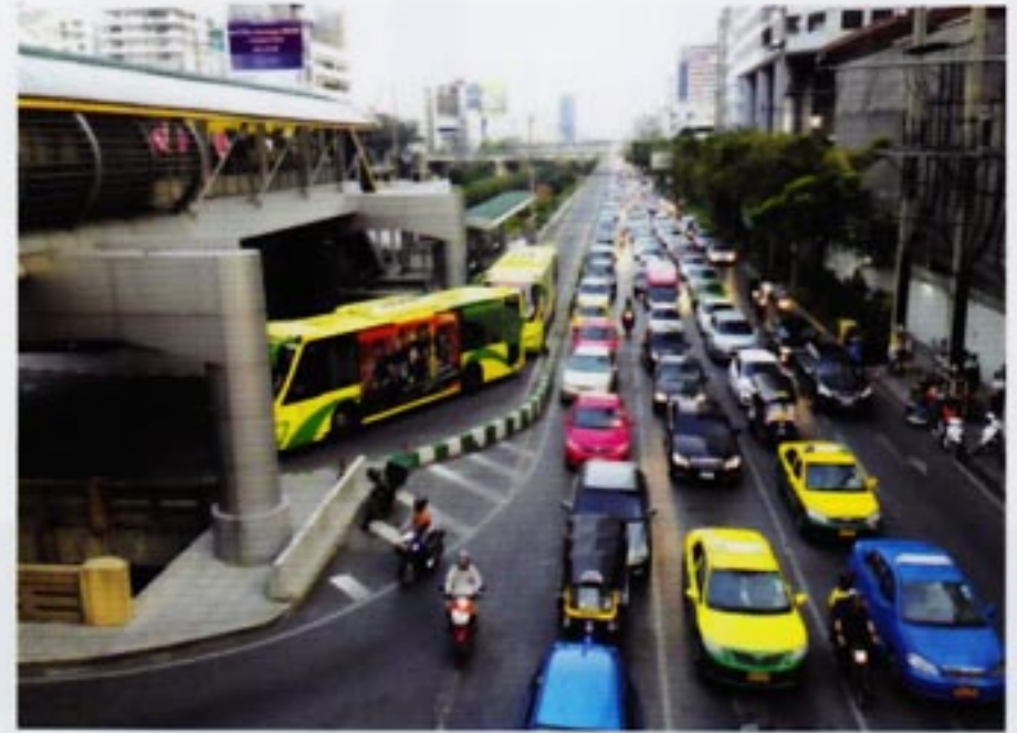
มลพิษทางอากาศจากรถ ควรแปลง BRT เป็นรถไฟฟ้าเพื่อสิ่งแวดล้อม

ประเด็นสำคัญนั้น ความเป็นคนดีหรือคนไม่ดีนั้นไม่ใช่สิ่งถาวร แต่เป็นสิ่งสัมพัทธ์ ที่แปรผันได้ ตัวอย่างหนึ่งที่เราเห็นได้ชัดก็เช่น ชาวสิงคโปร์คนหนึ่งอาจขับรถสุภาพเรียบร้อยถูกต้องตามกฎหมายจราจรโดยเคร่งครัด แต่คนๆ เดียวกันนั้น ก็อาจกลับขับฉวัดเฉวียน ผ่าฝืนกฎจราจรเมื่อข้ามมาฝั่งมาเลเซีย และหากถูกตำรวจจับ ก็พร้อมที่จะติดสินบนเล็กๆ น้อยๆ เพื่อให้ไม่ถูกลงโทษ หากคนผู้นั้นข้ามมายังฝั่งไทยก็อาจยังมีพฤติกรรมที่ย่ำแย่ลงกว่านี้อีกก็เป็นได้ และยิ่งหากขับไปถึงพม่าได้ ก็ยิ่งจะมีพฤติกรรมถดถอยลงตามลำดับ เป็นต้น